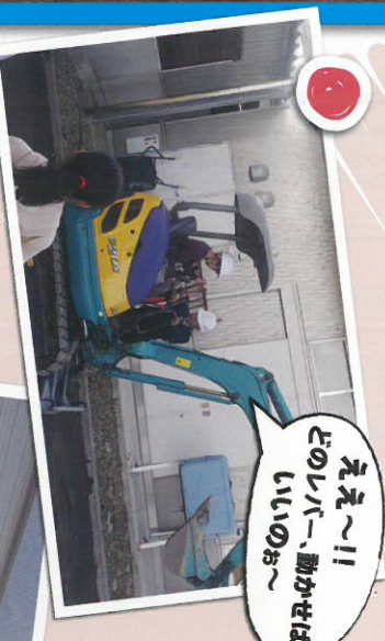
ええ〜!! どのレベル、動かせるのよ!!

11月18日(月)に豊川小学校6年生15名が本校に機械科、電気電子、建設、商業(2科)の五科ごとに、実習体験を体験し、建設科では、児童が生徒の指導を受けながら、パワーショベルやドローンの操作、体験を行いました。