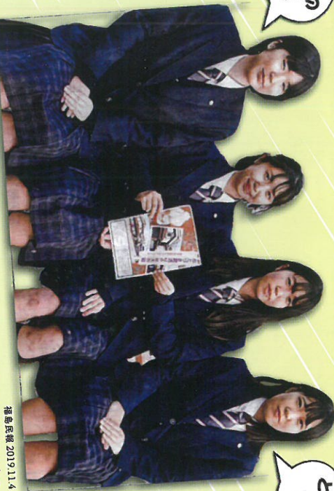
わたしたちのPR作戦!!